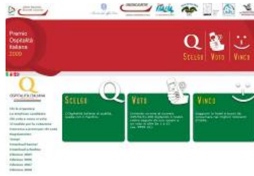
Portale Premio ospitalità