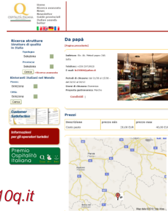
Portale Ospitalità Italiana www.10q.it